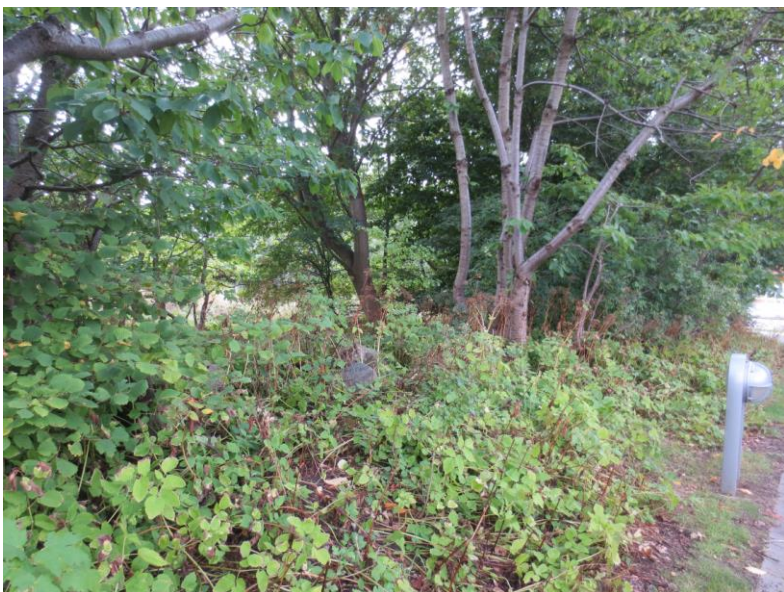
Foto 2015. Diget med sten øst for stien mellem Rørtangvej og Skibsegen.