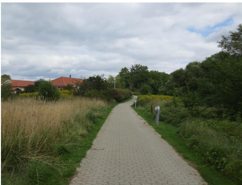
Foto 2015. Stien mellem Rørtangvej og Skibsegen.

Diget løber i dag langs gang- og cykelstien, der fører fra boligområdet Skibsegen til Rørtangvej. Det ligger på østsiden af stien og opleves som et grønt bånd på grund af hegnstræerne. Stedvist er det sammensunket og med "færdselsspor/hundelufterspor" henover.