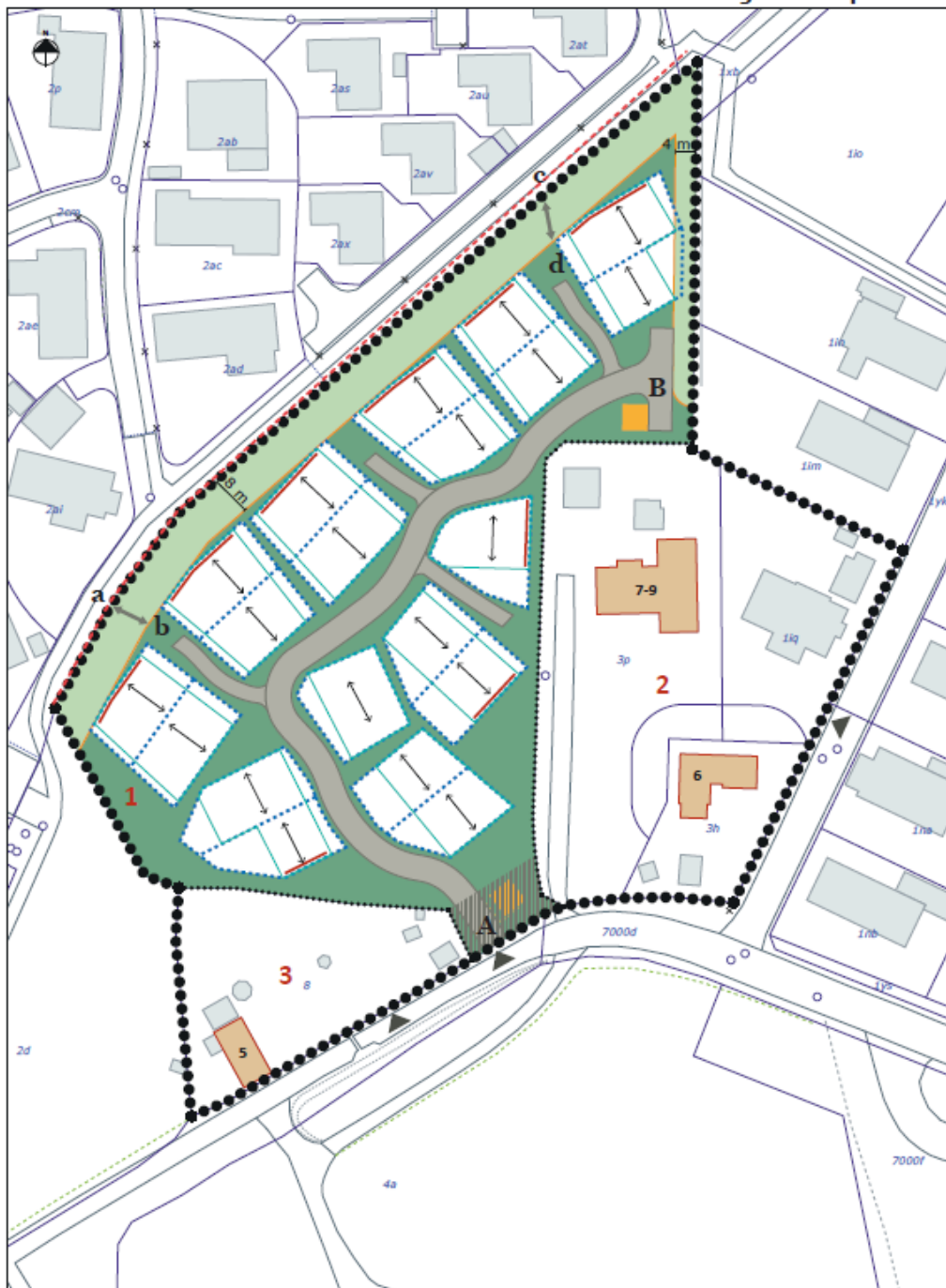
Lokalplankort Lokalplan 1.109 Boliger ved Rørtangvej i Snekkersten Forslag af den 29. januar 2018